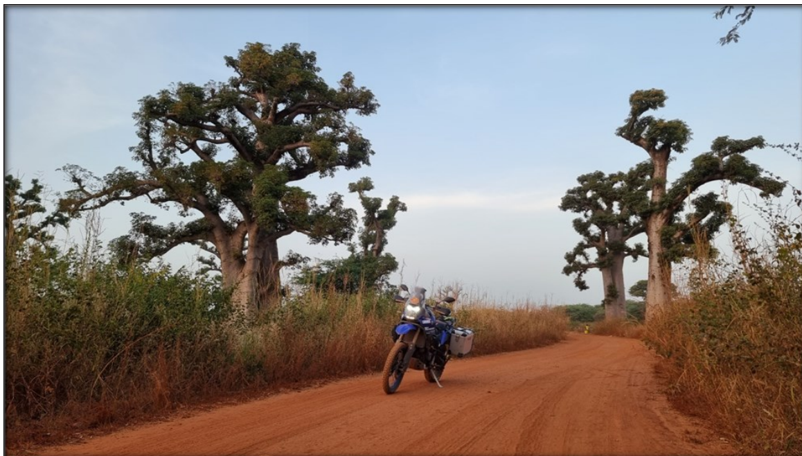
Baobab su una pista senegalese

19°/20° giorno, dopo aver girovagato 11 giorni tra Senegal, Gambia e Casamance rientro in Mauritania e da ora in poi la bussola segnerà costantemente Nord;