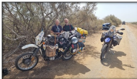
In attesa dell'imbarco a Banjoul Incontri lungo la pista di Diama