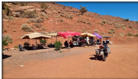
Vecchio Ksar Tafnildt Pausa Tè lungo strada