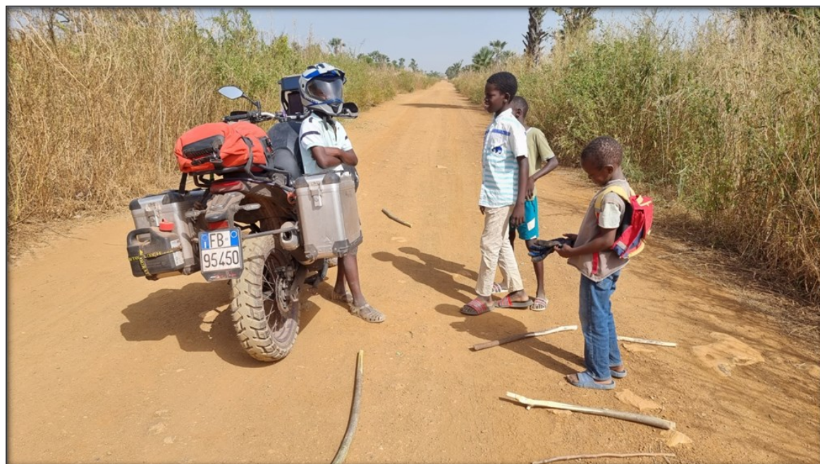
Incontri lungo una pista