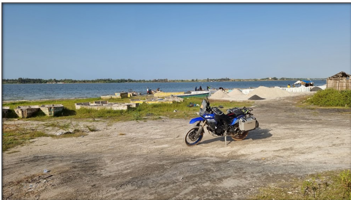
Il Lago Rosa e le sue saline

11°/12° giorno, proseguo verso sud in direzione Gambia facendo un mix tra asfalto e piste in terra rossa lambendo il Delta di Saloun con i suoi panorami mozzafiato;