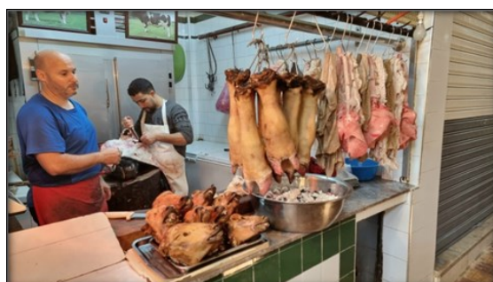
Mercato di Tangeri